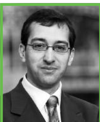
Remi Feraud maire du 10 e arrondissement

Depuis 10 ans, la politique menée par la Ville de Paris montre qu'il est possible de concilier dynamisme économique, justice sociale et développement durable. À cet effet, de nombreuses initiatives ont été prises pour répondre à ce défi majeur de notre temps. Avec trois priorités : les transports (développement du tramway, introduction de Vélib et bientôt d'Autolib), le bâti (diminution de la consommation d'énergie dans les logements sociaux et les équipements municipaux) et les déchets (développement du tri sélectif, expérimentation du compostage en pied d'immeuble).